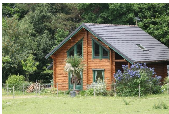
Illustration d'une maison pendant et après embellissement