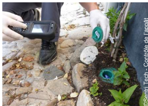
Contrôle de l'appât