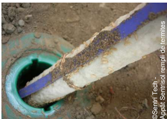
Appât Sentrisol rempli de termites