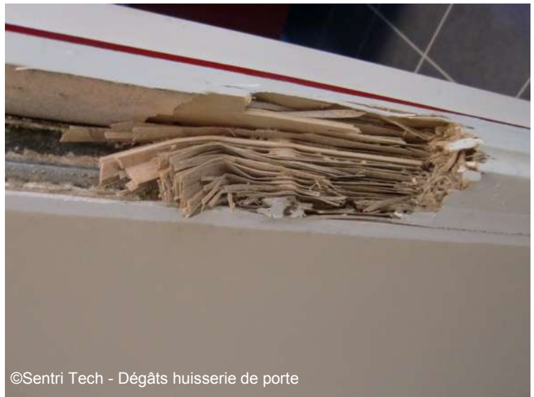
Dégâts huisserie de porte

Face au fléau des nuisibles, la lutte s'intensifie à l'encontre des punaises de lit, termites, rats, chenilles, frelons asiatiques, blattes ou encore cafards. À la crise environnementale va bientôt s'ajouter une crise de santé publique avec, en perspective, le retour d'une trentaine de maladies oubliées. Les professionnels du secteur 3 D alertent d'ailleurs sur la recrudescence du phénomène dû, notamment, au réchauffement climatique et à la restriction des biocides pour des raisons environnementales, laquelle rend les traitements moins radicaux... Avec la multiplication des espaces verts et des composts, les petites bestioles connaissent un sursaut de vigueur et engendrent d'énormes dégâts. Désormais, on compte 36 sortes d'insectes et 10 sortes de rongeurs. Alors, que pensent les applicateurs SENTRI TECH de l'alternative que représente la lutte raisonnée par piège contre les termites ?