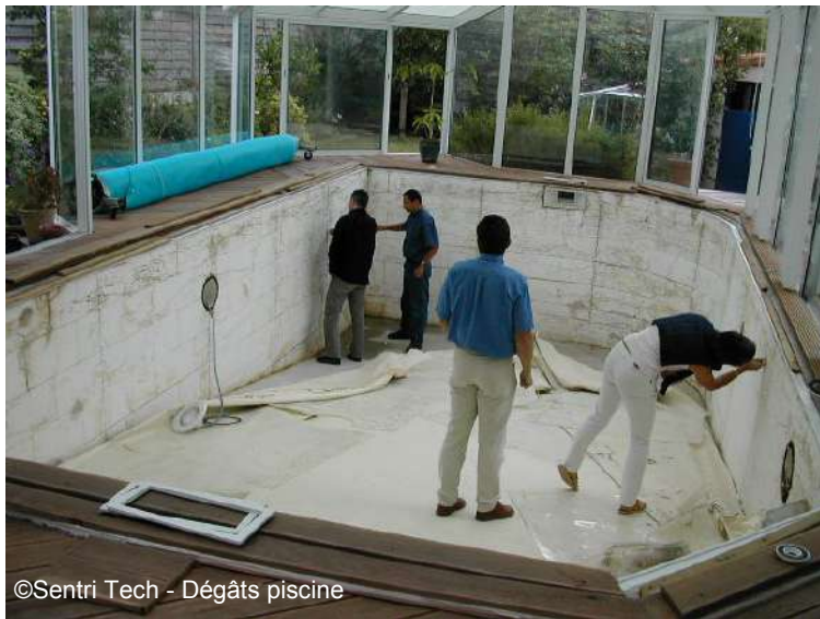
Dégâts piscine