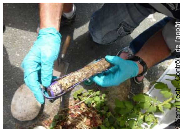
Contrôle de l'appât