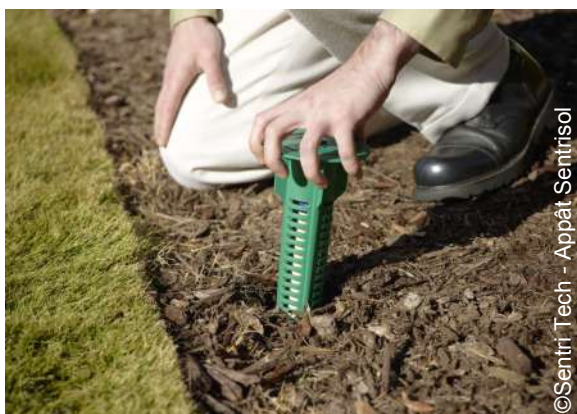
Appât Sentrisol

Curative, la première étape consiste donc à enrayer l'infestation . Vient ensuite l'étape de protection active , lors de laquelle l'appât reste présent dans les stations, même une fois les termites éliminés. Cette présence permanente de l'appât est justement là pour éviter tout risque de ré-infestation par une nouvelle colonie. Si des termites s'approchent à nouveau, ils vont spontanément consommer l'appât et la colonie sera contaminée dès le premier contact, puis détruite. Les applicateurs autorisés SENTRI TECH des entreprises Lorillou et TTBR vont alors effectuer des contrôles réguliers afin de vérifier si les stations sont, ou non, « réinvesties » par les termites.