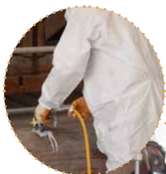
injection du gel biocide et application sur toutes les faces du bois

Matériau très résistant, le bois peut néanmoins connaître des agressions notamment lorsqu'il est soumis à un risque d'humidité ponctuelle comme cela peut être le cas des charpentes et éléments de toiture. Au Prieuré de la Charité sur Loire, il était essentiel de protéger la charpente existante sur laquelle de légères traces de vrillettes* avaient été décelées. Cette mission a été confiée à l'entreprise certifiée CTB-A+ qui, outre son expertise, bénéficie d'un savoir-faire reconnu dans la préservation du patrimoine historique.