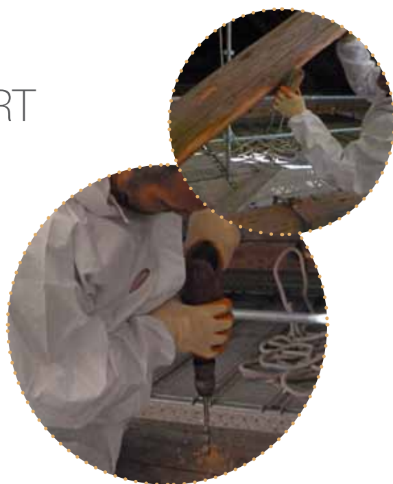
dépoussiérage et préparation de l'injection

- l'application sur toutes les faces du bois du produit biocide afin de prévenir tout risque de ponte.