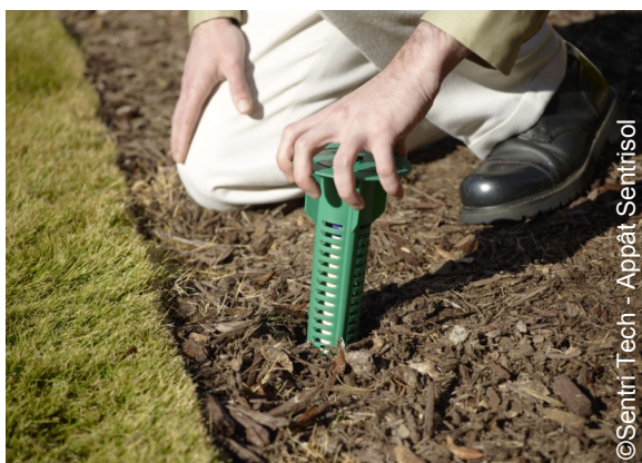
Appât Sentrisol

Curative, la première étape consiste donc à enrayer l'infestation . Vient ensuite l'étape de protection active , lors de laquelle l'appât reste présent dans les stations, même une fois les termites éliminés. Cette présence permanente de l'appât est justement là pour éviter tout risque de ré-infestation par une nouvelle colonie. Si des termites s'approchent à nouveau, ils vont spontanément consommer l'appât et la colonie sera contaminée dès le premier contact, puis détruite. Les applicateurs autorisés SENTRI TECH des entreprises Lorillou et TTBR vont alors effectuer des contrôles réguliers afin de vérifier si les stations sont, ou non, « réinvesties » par les termites.