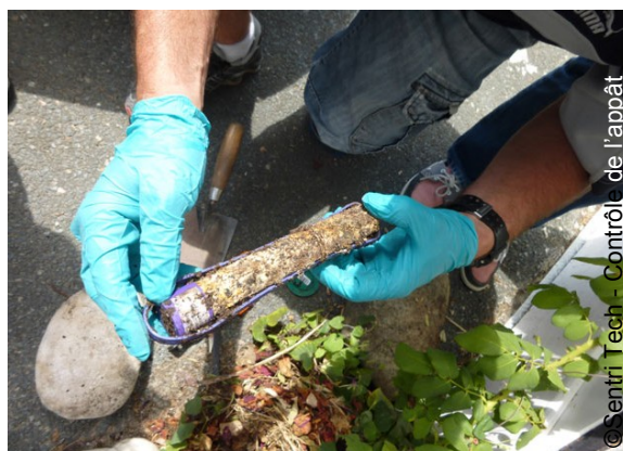
Contrôle de l'appât