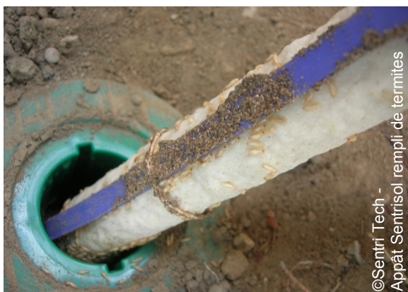
Appât Sentrisol rempli de termites