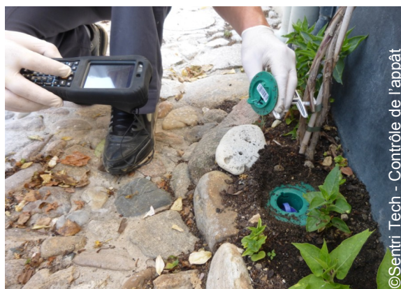
Contrôle de l'appât