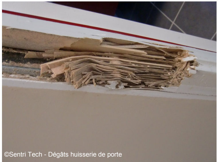
Dégâts huisserie de porte

Face au fléau des nuisibles, la lutte s'intensifie à l'encontre des punaises de lit, termites, rats, chenilles, frelons asiatiques, blattes ou encore cafards. À la crise environnementale va bientôt s'ajouter une crise de santé publique avec, en perspective, le retour d'une trentaine de maladies oubliées. Les professionnels du secteur 3 D alertent d'ailleurs sur la recrudescence du phénomène dû, notamment, au réchauffement climatique et à la restriction des biocides pour des raisons environnementales, laquelle rend les traitements moins radicaux... Avec la multiplication des espaces verts et des composts, les petites bestioles connaissent un sursaut de vigueur et engendrent d'énormes dégâts. Désormais, on compte 36 sortes d'insectes et 10 sortes de rongeurs. Alors, que pensent les applicateurs SENTRI TECH de l'alternative que représente la lutte raisonnée par piège contre les termites ?