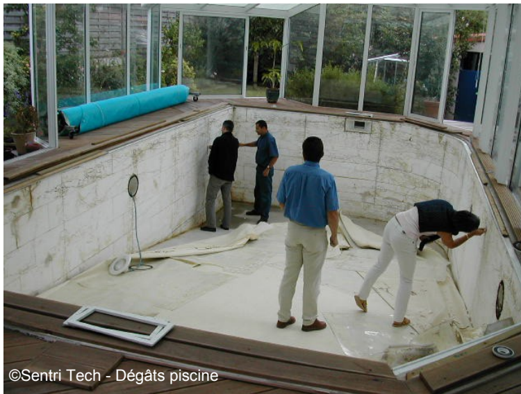
Dégâts piscine