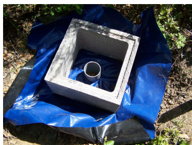
Essai expérimental XYLOPHENE TERMIPROTECT ® Film (DYRUP)