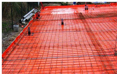
KORDON ® (BAYER)