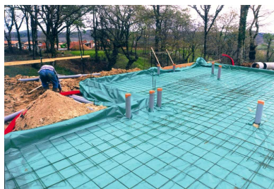
TERMIFILM ® (BERKEM)

(2) : Autres appellations commerciales : CULTISOL ISOFILMA, TERMIPLAST