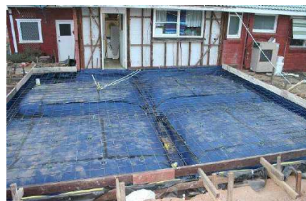
TRITHOR ® (ENSYSTEX)