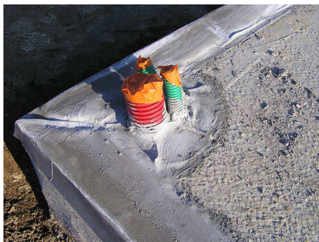
Barrière physique TERMIMESH®

En ce qui concerne la mise en œuvre de ce système par les entreprises titulaires de la certification de service CTB A+, les préconisations d'emploi, validées par l'Avis technique délivré par le CSTB, sont encadrées dans un référentiel de prescriptions techniques spécifique à la mise en application du décret 2006-591. Par ailleurs, les entreprises doivent suivre une formation et être agréées par le fabricant avant d'être autorisées à commercialiser le système.